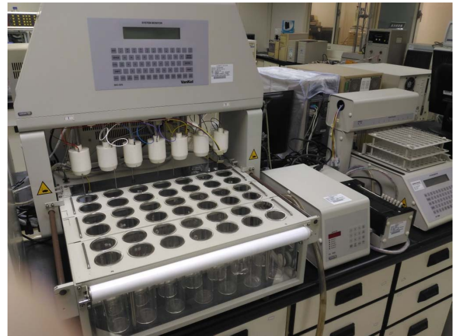
腸溶控釋劑型溶離測試